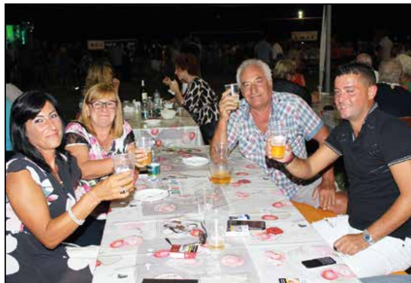
Tavolo con famigliari ad una delle feste.

Nel frattempo anche la Pro Loco, protagonista di un'innomerevoli appuntamenti che