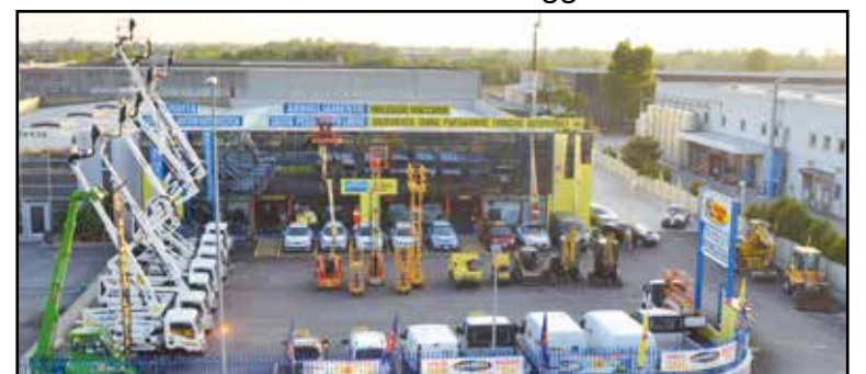
La nuova sede della Noleggio Lorini in zona industriale, via E. Montale 15.

SEDE: MONTICHIARI (BS) - Via E. Montale, 15 FILIALI: CALCINATO - CASTEGNATO tel. 030.9650556 - www.noleggiolorini.com