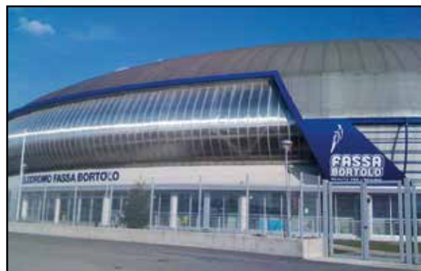
Il Velodromo di Montichiari.

Con la domanda dell'Amministrazione comunale per la richiesta di contributi la Giunta Nazionale del CONI ha proposto al Governo per reperire le risorse tramite gli interventi