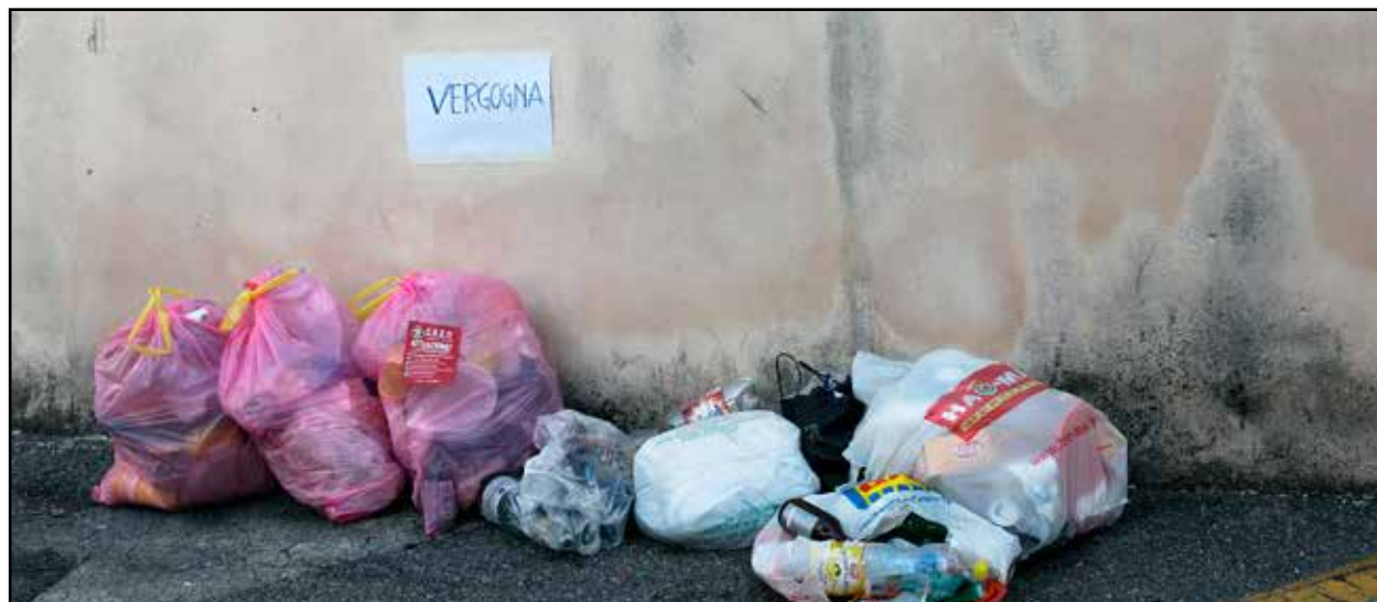
Sacchetti abbandonati non in regola con le norme CBBO.